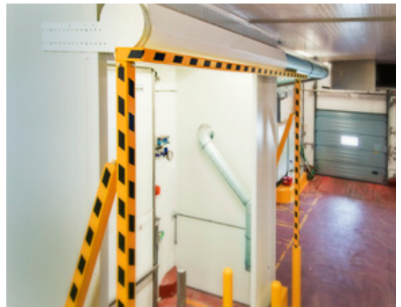
Bovenaanzicht Luchtdeur en sluis